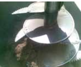
Trinciatura del fiorume con carro miscelatore

Dopo la raccolta il fiorume va sottoposto a trattamenti minimi, dettati dal buon senso.