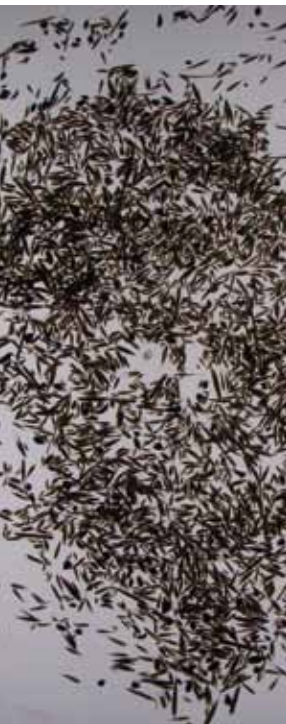
Seme puro ottenuto da fiorume

saranno probabilmente più rappresentate, mentre quelle più rare saranno scarse anche nel miscuglio finale. La disponibilità di un elenco floristico è inoltre di fondamentale importanza per l'individuazione delle specie guida * (v. anche pag. 16), e unitamente ai dati sulla produzione specifica in semi (peso e numero di semi prodotti per pianta), può servire per una stima della produttività del prato. In laboratorio si passa ai punti successivi: come si accennava, una volta raccolto il fiorume è utile definire in laboratorio 4 ulteriori parametri: la purezza del materiale, il contenuto in semi per unità di peso, la composizione specifica e il tasso di germinazione.