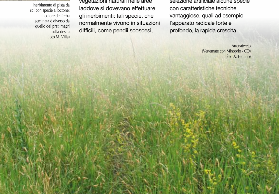
Arrenatereto (Vertemate con Minoprio - CO)

soggetti ad erosione e suoli poveri di nutrienti, magari in condizioni climatiche estreme (basse temperature, aridità, vento ecc.), sono certamente quelle che possono offrire le maggiori chances di successo. Su questa base due scuole di pensiero e quindi due categorie di materiali da semina sono stati "prodotti". Un primo approccio, per così dire classico , ha individuato e migliorato tramite selezione artificiale alcune specie con caratteristiche tecniche vantaggiose, quali ad esempio l'apparato radicale forte e profondo, la rapida crescita