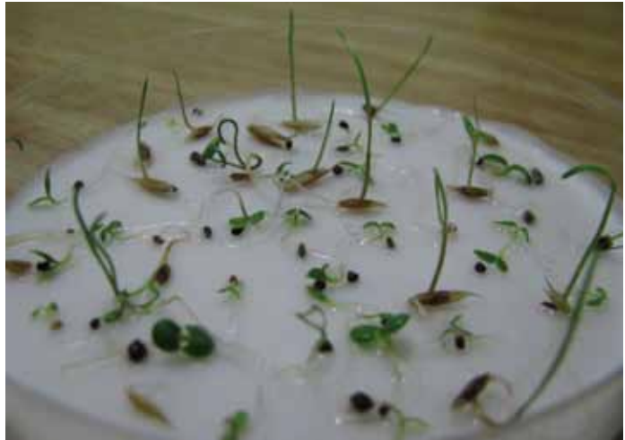
Test di germinazione del fiorume in laboratorio

L'analisi del prato donatore consiste sostanzialmente nella classificazione della vegetazione secondo il metodo fitosociologico, grazie al quale è possibile “dare un nome” al prato stesso sulla base del complesso delle piante in esso presenti e della loro frequenza. In questo modo si ha un'idea della composizione in specie del fiorume che verrà poi raccolto, e teoricamente della quantità relativa di ciascuna specie: le specie dominanti