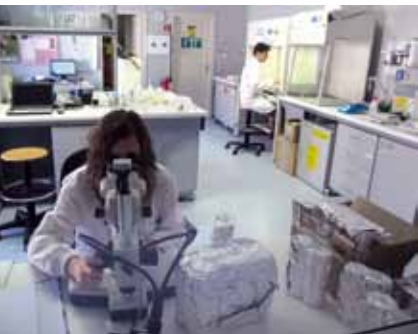
Il "Laboratorio per la conservazione della biodiversità vegetale" del CFA