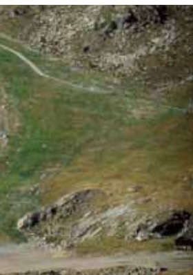
Inerbimento di pista da sci con specie alloctone: il colore dell'erba seminata è diverso da quello dei prati magri sulla destra

addirittura eventi franosi. Fortunatamente, grazie ad interventi legislativi e alla mutata sensibilità della popolazione e degli operatori, negli ultimi decenni del XX secolo si è avviato anche in Italia un processo di innalzamento della qualità dei materiali da semina presenti sul mercato. Botanici, agronomi e paesaggisti hanno iniziato ad osservare le specie presenti spontaneamente nelle vegetazioni naturali nelle aree laddove si dovevano effettuare gli inerbimenti: tali specie, che normalmente vivono in situazioni difficili, come pendii scoscesi,