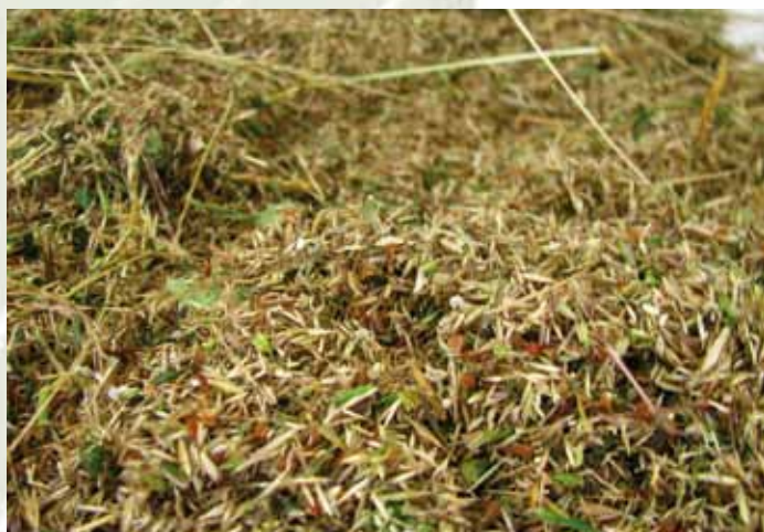
Fiorume appena raccolto

raccoglie nei fienili, ma anche e soprattutto un miscuglio di semi di elevato pregio naturalistico, intenzionalmente prodotto a partire da un prato naturale o semi-naturale mediante trebbiatura diretta del fieno. È semplice intuire che se il prato donatore è ricco di specie vegetali, il fiorume ne rispecchierà la biodiversità, e, se tali specie sono pure autoctone, la semente rappresenterà un materiale di alta qualità per inerbimenti e ripristini ambientali. Il fiorume è stato infatti riscoperto in chiave moderna, tanto che macchine agricole costruite ad hoc sono in grado