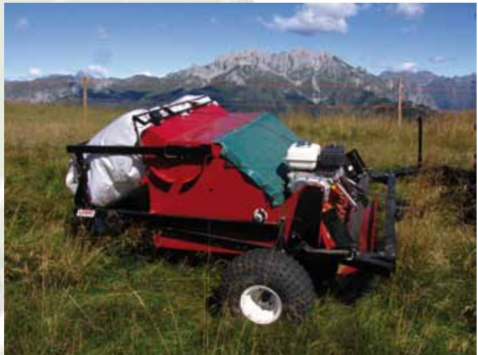
Raccogliatore di fiorume da traino

la raccolta sia dei semi più grossolani e pesanti sia di quelli con pezzatura inferiore, assicurando in ultima analisi un'elevata ricchezza in specie del miscuglio finale. Il fatto che l'erba non venga tagliata è importante, perché significa che dopo la raccolta del fiorume si potrà comunque pascolare oppure raccogliere il fieno nello stesso prato: la raccolta del fiorume è dunque una modalità interessante di integrazione del reddito e non una alternativa all'attuale uso