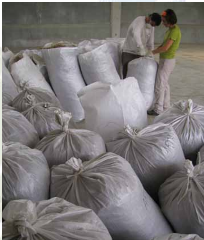
Sacchi di fiorume pronti per la semina

semina più volte negli anni successivi al primo intervento (con ovvi aggravii di spesa), e, nelle situazioni più gravi, di intervenire con opere massicce per contenere l'erosione se non