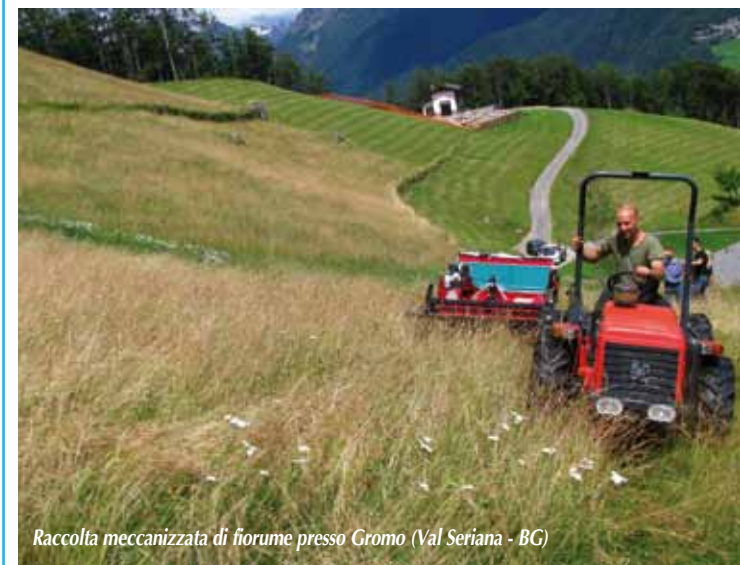
Raccolta meccanizzata di fiorume presso Gromo (Val Seriana - BG)

Il Centro Flora Autoctona della Regione Lombardia (CFA) è gestito dal Parco Monte Barro con la collaborazione delle Università degli Studi dell'Insubria e di Pavia e della Fondazione Minoprio.