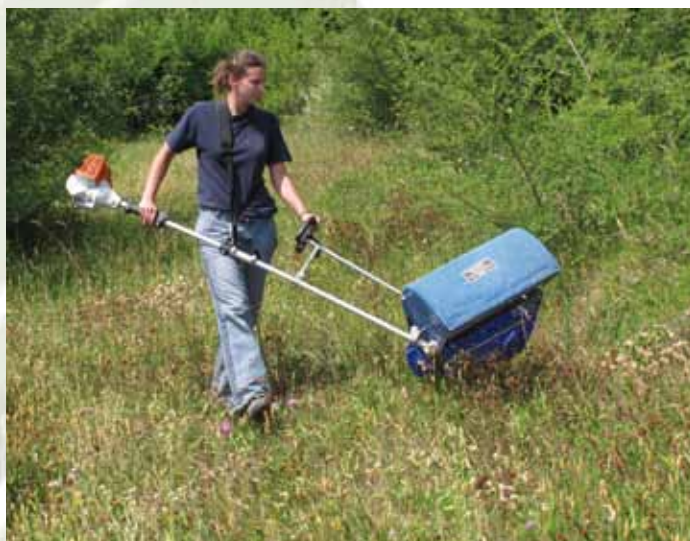
Raccoglitore di fiorume a spalla

montane con pendenza pari addirittura a 30-35°. In situazioni particolari, in alternativa alle spazzolatici trainate, si possono impiegare spazzolatici a spalla: la resa è decisamente più bassa, ma in questo modo è possibile lavorare in aree molto impervie o assai piccole, inaccessibili al trattore, dove sono presenti specie donatrici di elevato significato naturalistico i cui semi possono essere impiegati per arricchire altri miscugli.